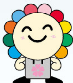
さいたま市選挙キャラクター みらいワフ